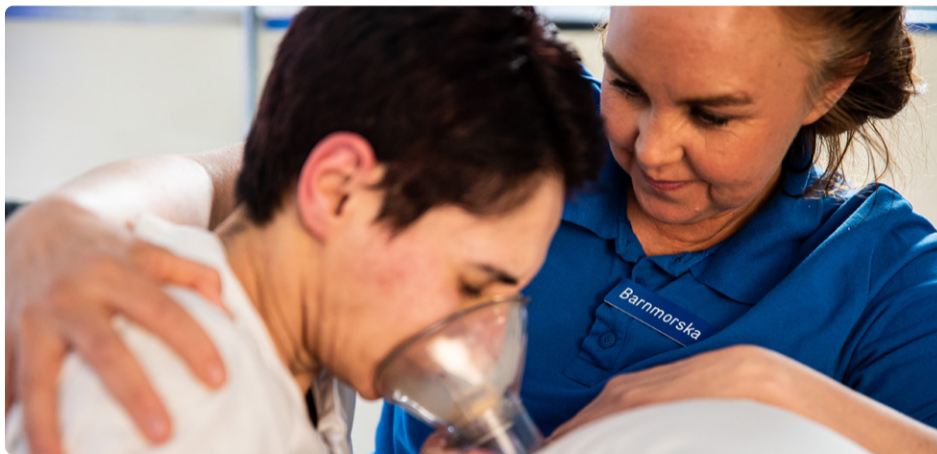
I Region Halland har viss personal erbjudits 32 timmars arbetsvecka med bibehållen lön.

Ett av Vänsterpartiets skarpaste krav är alltså en förkortning av arbetstiden. Sex timmars arbetsdag har länge stått på agendan men att få gehör för det har varit så när som omöjligt i det nyliberala debattklimat som funnits sedan 1990-talets ekonomiska kris. I stället för