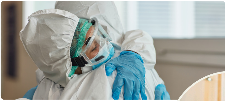
Pandemin visade på bristerna i välfärden. Vänsterpartiet vill bygga samhället starkt igen.

att välfärden ska bli sämre hela tiden, det beror helt på politiska beslut. Vi måste ta tillbaka kontrollen över skola, vård, omsorg och infrastruktur. Det fungerar inte att ge mindre och mindre pengar till verksamheter som dessutom ska ge en allt större andel av de pengarna till privata bolagsvinster. Det har slagit sönder välfärden och skapat otrygghet.