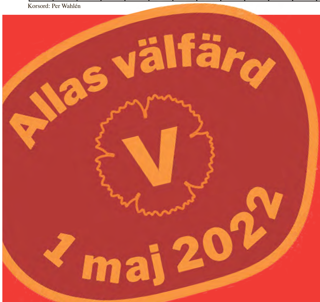
Korsord: Per Wahlén