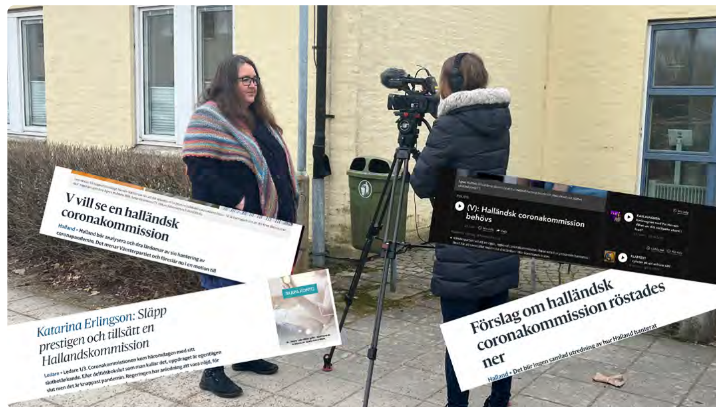
Vänsterpartiets krav på en halländsk Coronakommission har uppmärksammats stort av media.

– Vi är inte de enda som vill se en kommission. Det är så otroligt viktigt att vi får till detta så inte livsviktiga erfarenheter går till spillo, säger hon. ■