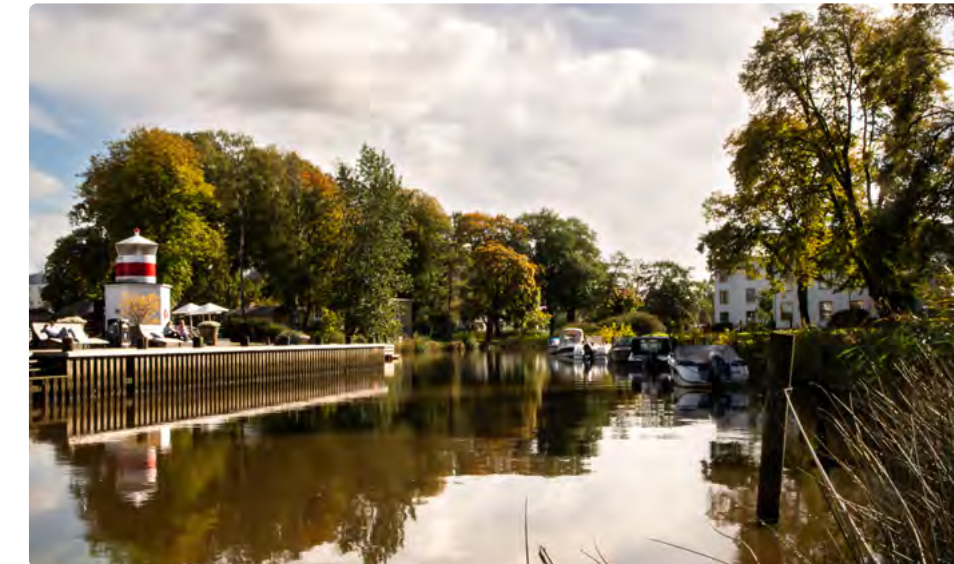
Den första maj samlas Vänsterpartiet i kulturhuset Fyren.

Den första maj, arbetarnas dag samlas Vänsterpartiet Kungsbacka i kulturhuset Fyren. Det blir tal, musik och politiska samtal över en kopp kaffe. Du har också möjligheten att träffa många av oss som kämpar för en mer solidarisk politik i Kungsbacka kommun.