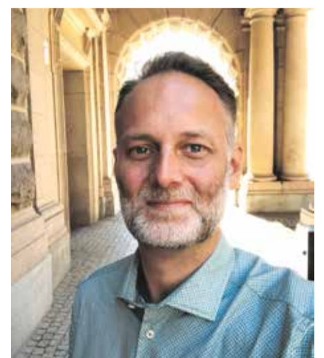
Jon Thorbjörnson, riksdagsledamot Vänsterpartiet