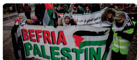
Palestinagrupperna syns på gator och torg.